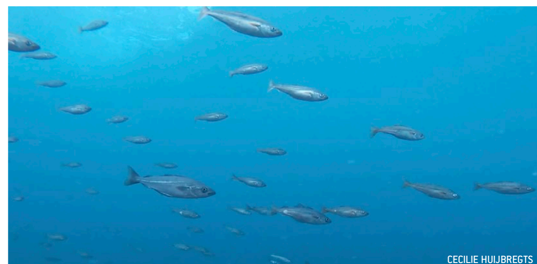
Kæmpe kammusling (ovenfor); Stime med små sej (ovenfor til højre); Kammuslinger blev samlet (i midten til højre).