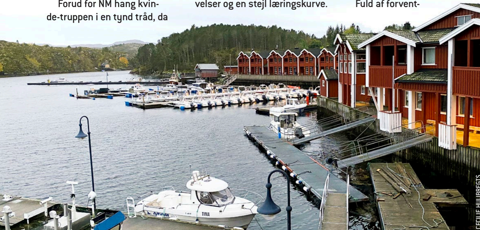
Angelamfi Hitra, nær et af de bedste fiskeområder i Norge, udlejer både og har store fileterings- og fryserum.